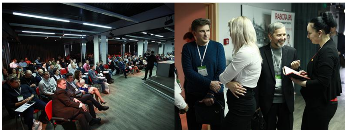
Международный Форум ВIT-2018 в Нижнем Новгороде собрал 259 участников

Форум представляет собой удобную площадку для коммуникаций , объединяющую наиболее инициативных представителей отрасли. Отметим, что в этом году форум посетили 259 участников!