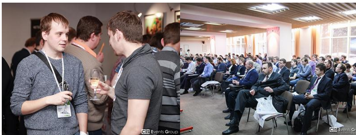
Международный Форум ВIT-2016 в Челябинске собрал 183 участника

Форум представляет собой идеальную площадку для коммуникаций , объединяющую наиболее инициативных представителей отечественного ИКТ-рынка. Стоит отметить, что в этом году челябинский форум посетили 183 участника!