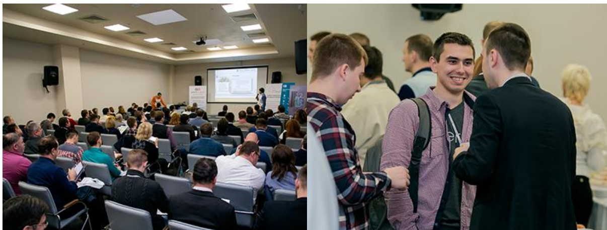
Міжнародний Форум ВІТ-2017 в Одесі зібрав 138 учасників

Форум являє собою зручний майданчик для комунікацій , що об'єднує найбільш ініціативних представників вітчизняного ринку інформаційних технологій та автоматизації. Відзначимо, що в цьому році Форум відвідали 138 учасників!